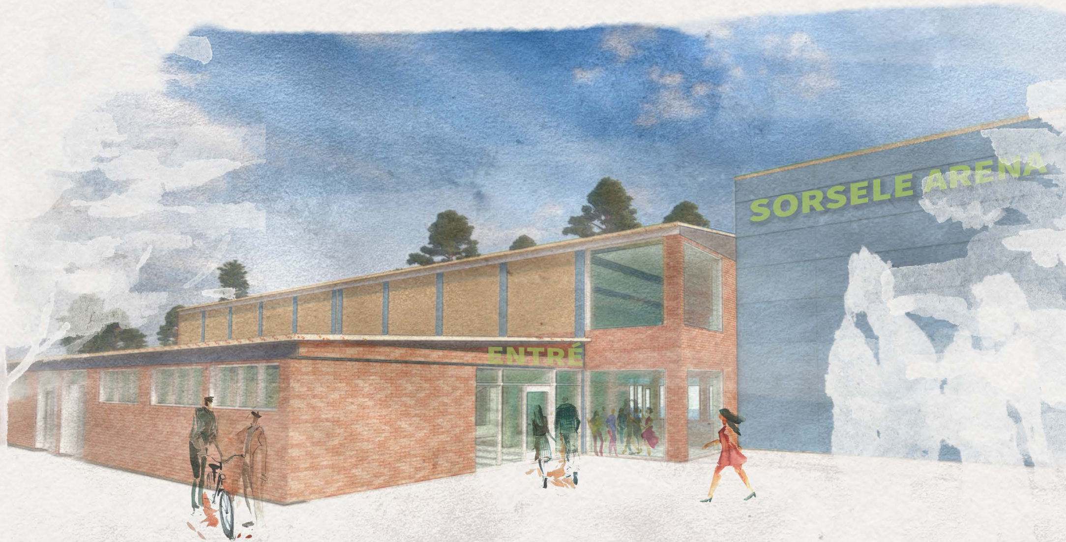
Illustration: Albin Holmgren, albin arkitektur. Illustrationen är en tidig idéskiss.