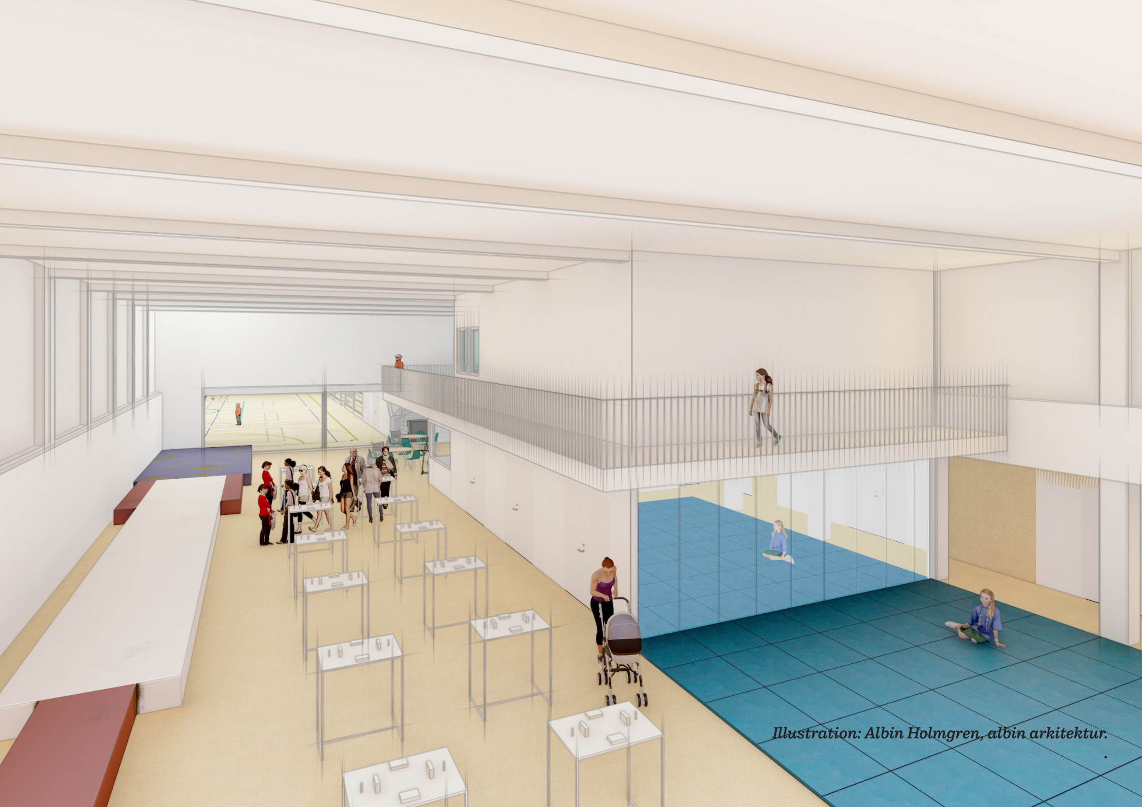
Illustration: Albin Holmgren, albin arkitektur.