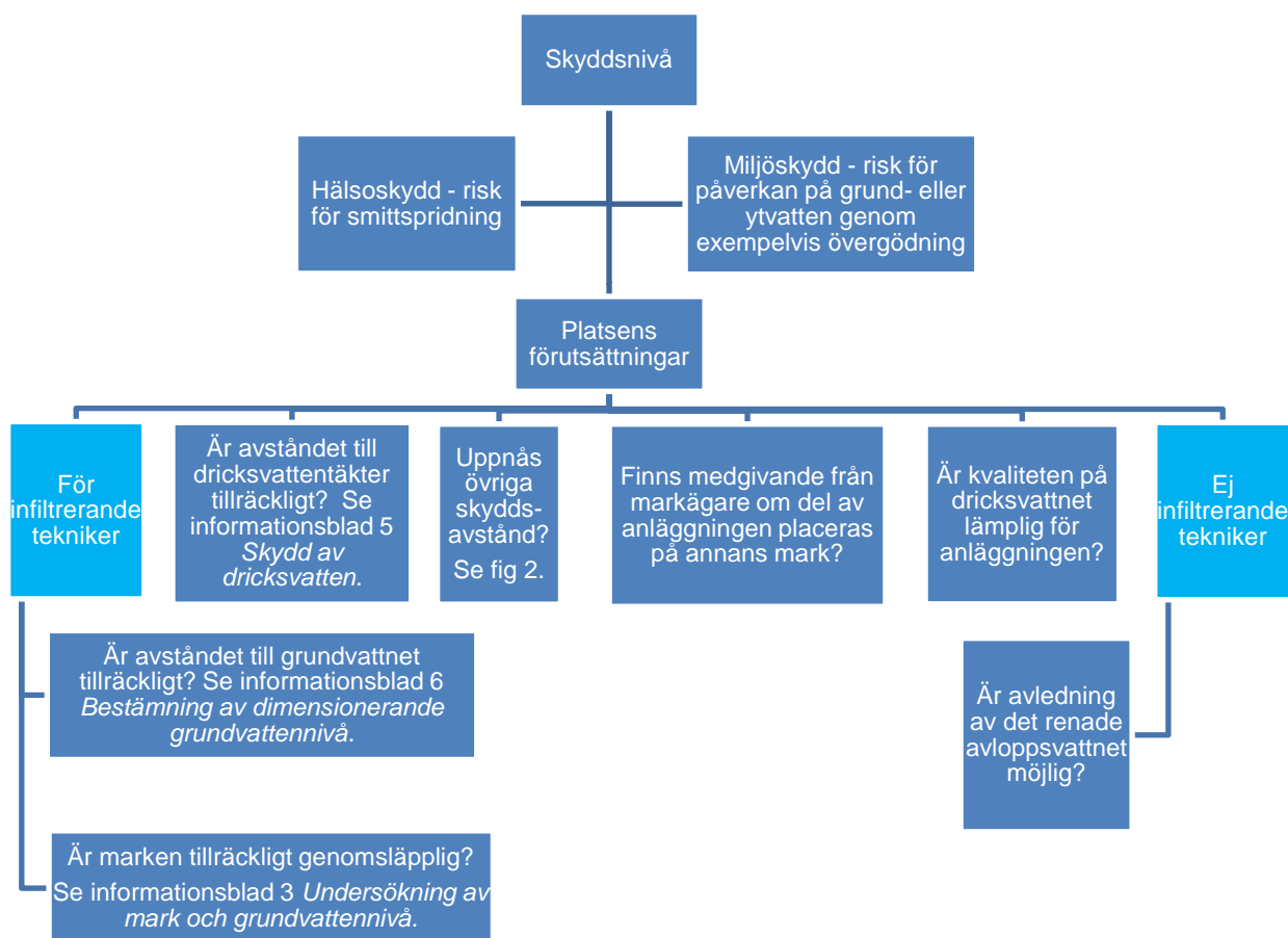
Figur 1. Skyddsnivå och platsens förutsättningar styr vilka avloppstekniker som är möjliga.